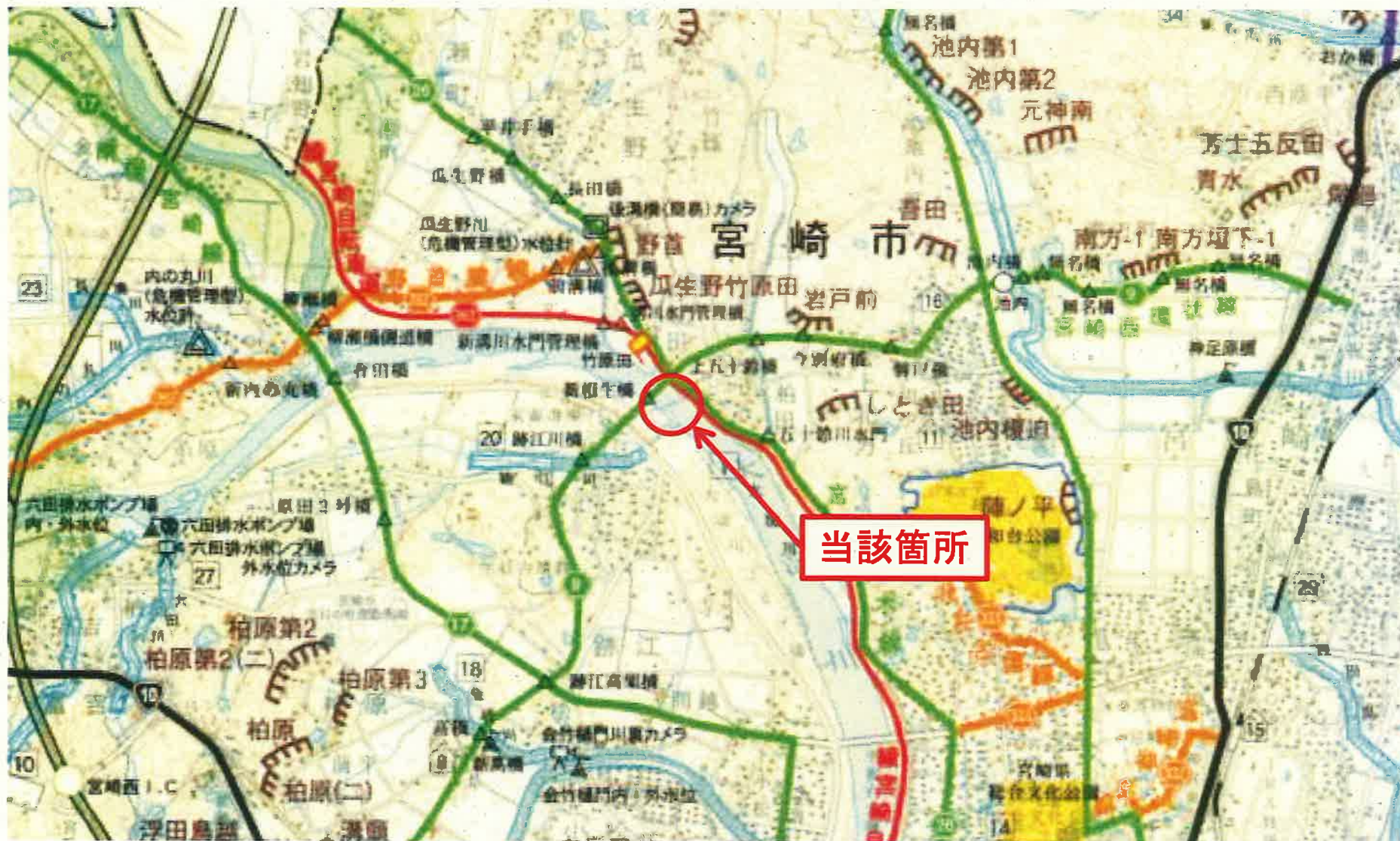
宮崎西環状線(松橋工区)