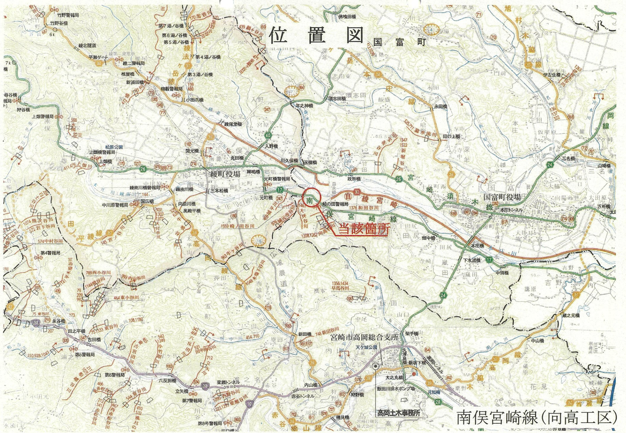
南 宮崎線 (向高工区)