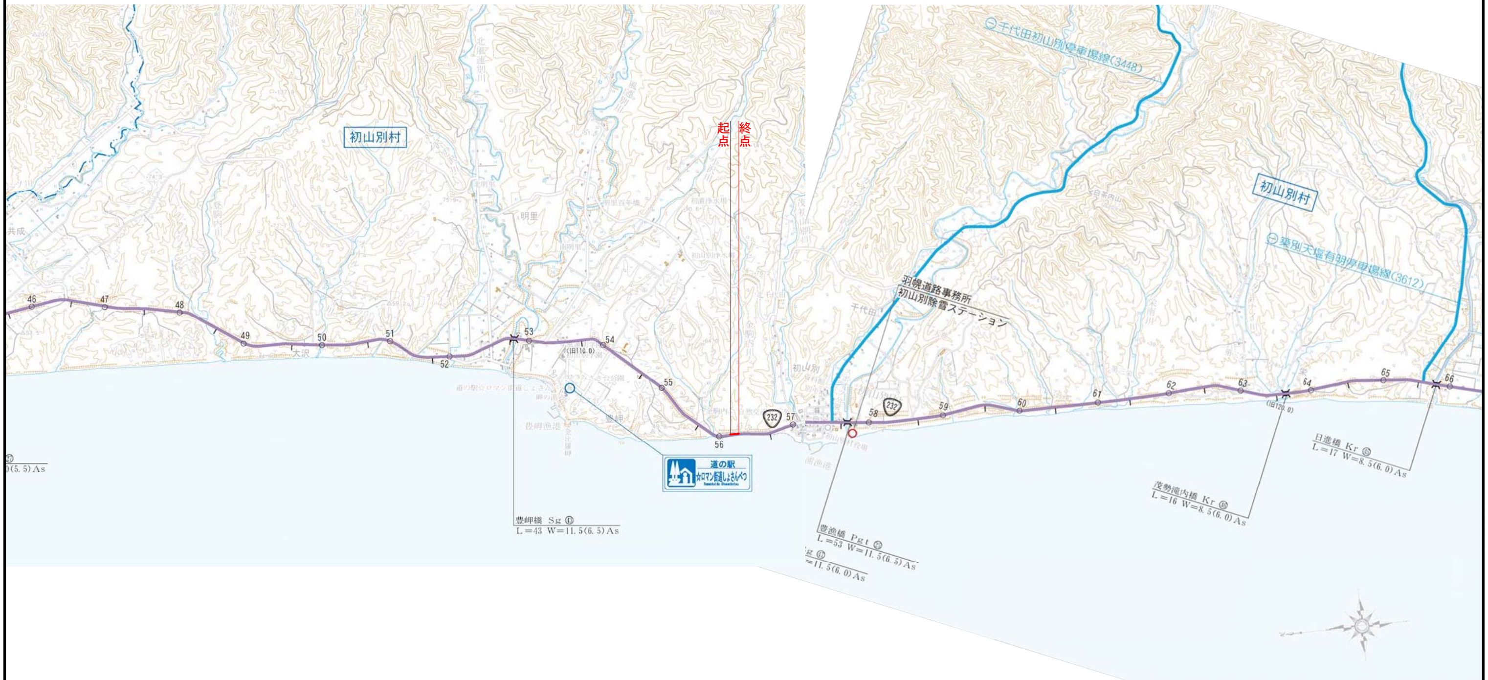
一般国道232号 区域変更位置図 縮尺 1 : 50,000

変更前 W=37.73~56.08 L=0.021km 変更後 W=43.84~56.08 L=0.021km